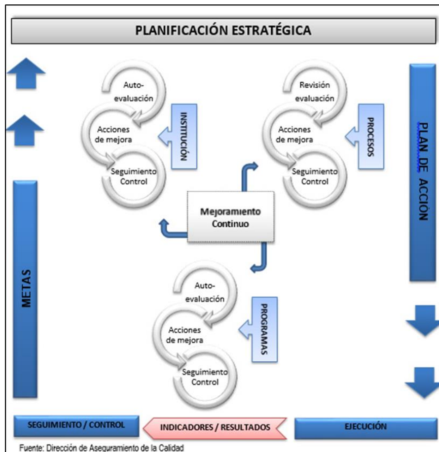
Figura 2: SAC como soporte y apoyo del Instituto Guillermo Subercaseaux.