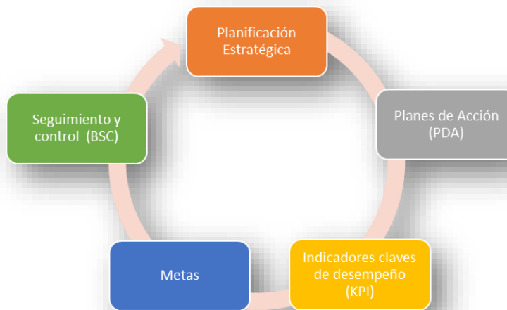
Figura 1: Mapa interacción de procesos-Planificación estratégica, Instituto Guillermo Subercaseaux.