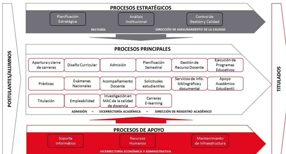
Figura 5: Mapa de procesos en el Instituto Guillermo Subercaseaux.