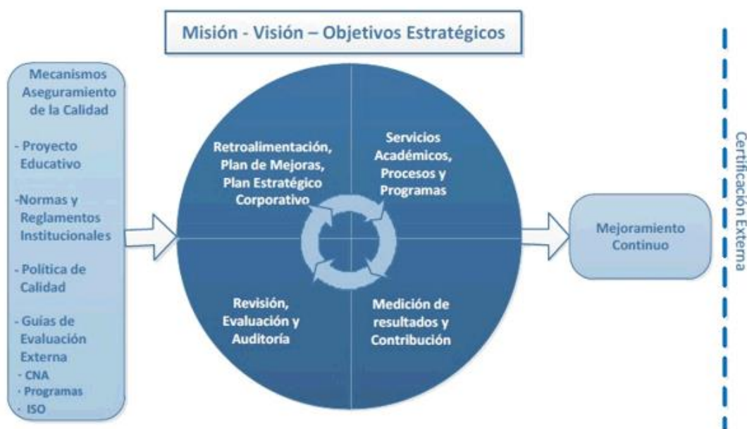
Figura 4: Entrada y Salidas-Ciclo de Calidad, Instituto Guillermo Subercaseaux.